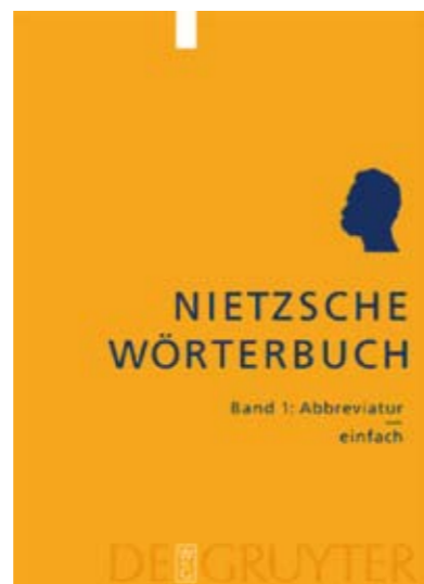
Het eerste deel van het Nietzsche Wörterbuch .