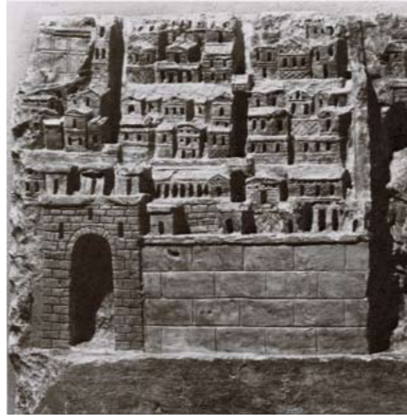
Zicht op een Romeinse stad.

In de Romeinse Republiek was veel land staatsbezit. Aan het eind van de Republiek was dat fenomeen bijna allemaal verdwenen. Eén aio heeft de juridische ontwikkeling van staatsland naar privéland in beeld gebracht. “Er leek een soort privatiseringsproces aan de gang te zijn. Dit kan verklaard worden door bevolkingsgroei. De druk op de grond nam toe en de burgers wilden sterkere rechten. Op deze manier zijn ook een aantal politieke conflicten uit de laatste eeuwen van de Republiek te verklaren. Zo was er een politicus die staatsland wilde verdelen onder de arme boeren. Nu is duidelijk waarom hij dat deed.”